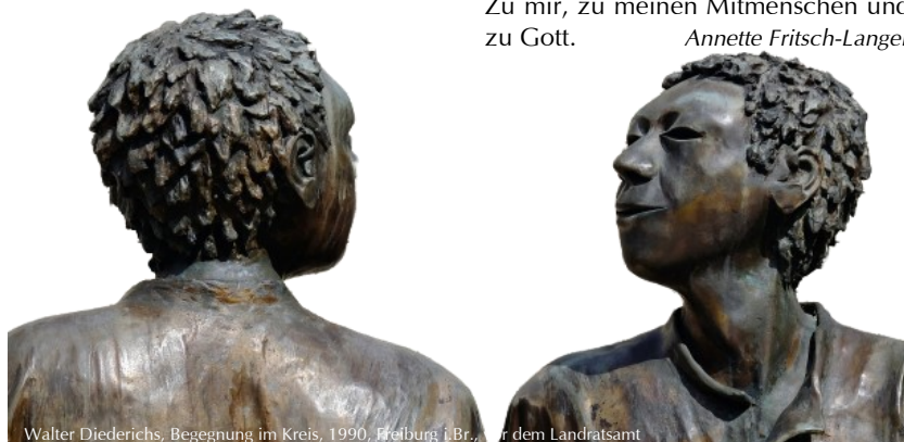
Walter Diederichs, Begegnung im Kreis, 1990, Freiburg i.Br., für dem Landratsamt